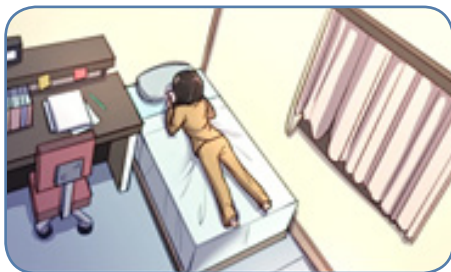
즐거운 학교생활, "여러분의 선택은?"[중등용]